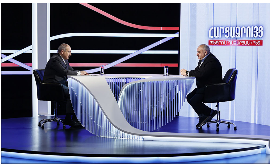
Նիկոլ Փաշինեան հաղորդավար Պետրոս Ղազարեանի հետ հարցազրոյցի ընթացքին

«Մենք ունենք միջազգայնօրէն ճանաչուած սահման, որը պէտք է գետնի վրայ արտայայտուի, հասկանում էք, սահմանը պէտք է գետնի վրայ արտայայտուի եւ դա բխում է Հայաստանի Հանրապետութեան շահերից: Հիմա եթէ օրինակ կը լինեն իրադրութիւններ, երբ սահմանազատման յանձնաժողովները կը գան, այդ թուում՝ ենթակառուցուածքներ, մարդկանց կեանքի կազմակերպման համար անհրաժեշտ է այս տարածքը, որը տէ՛ր իւր է, այսինքն՝ գտնուում է մի երկրի տարածքում, բայց պէտք է, անհրաժեշտ է, որ այդ երկրի այդ տարածքները փոխանակուեն, այդպիսի իրադրութիւններ, այդ