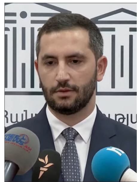
ՀՀ Ազգային ժողովի փոխխօսնակ Ռուբէն Ռուբինեան

«Բոլոր միջազգային գործընկերները հասկանում են, թէ ինչ սպառնալիքների է բախուում Հայաստանը: Մեր բոլոր միջազգային գործընկերներից ակնկալում ենք աջակցութիւն ՀՀ ինքնիշխանութեանն ու տարածքային ամբողջականութեանը: Մենք ամէն ինչ պէտք է անենք, որ