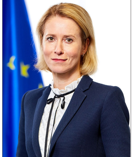
Եւրոպական Միութեան բարձր ներկայացուցիչ Գայա Քալաս տեսուին նաեւ այլ բարձրաստիճան այցելութիւններ:

«Մօտ շաբաթներին կ'ունենանք Եւրոպական Միութեան բարձր ներկայացուցիչ Գայա Քալասի այցը Հայաստան», - տեղեկացուց Յովհաննիսեան՝ յաւելելով, որ կը նախա-