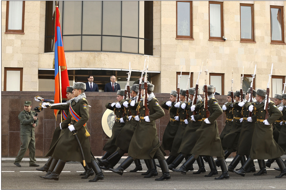
Հայաստանի Զինուած Ուժերու ստորաբաժանումներու քայլերթը

Հայաստանի Հանրապետութեան Զինուած Ուժերու կազմաւորման 33-րդ տարեդարձին առիթով վարչապետ Նիկոլ Փաշինեան այցելած է Պաշտպանութեան նախարարութիւն: ԶՈՒ ստորաբաժանումներու մասնակցութեամբ նախ տեղի ունեցած է քայլերթ, որմէ յետոյ հանդիսաւոր նիստ՝ ԶՈՒ բարձրագոյն սպայակազմի մասնակցութեամբ: