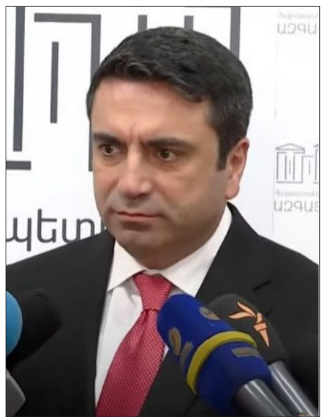
Ազգային ժողովի նախագահ Ալէն Սիմոնեան

«Պելառուսը դեկավարող անձը այսօր փորձում է ստեղծուած իրավիճակից ինչ-որ ելք գտնել: Իսկ ի՞նչ է ստեղծուած իրավիճակը ստեղծուած իրավիճակը այն է, որ