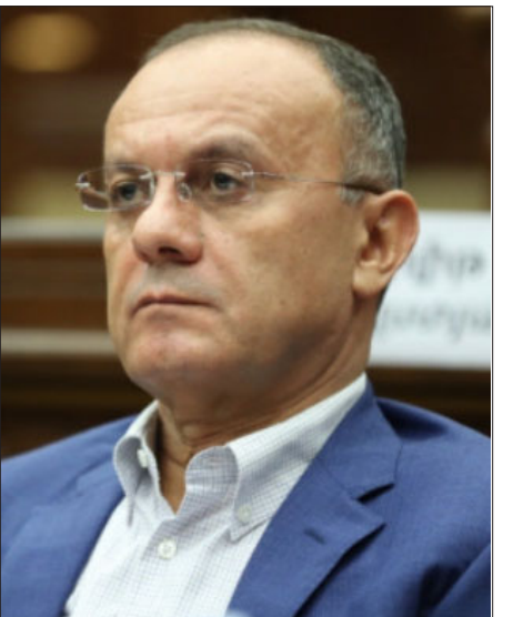
Պաշտպանութեան Գախարար Սէյրան Օհանեան

2008-ի Մարտ 1-ի գործով Գլխաւոր դատախազութիւնն անոր մեղադրանք ներկայացուց ընդդիմադիր «Հայաստան» խմբակցութեան ղեկավար, պաշտպանութեան նախկին նախարար Սէյրան Օհանեանին: