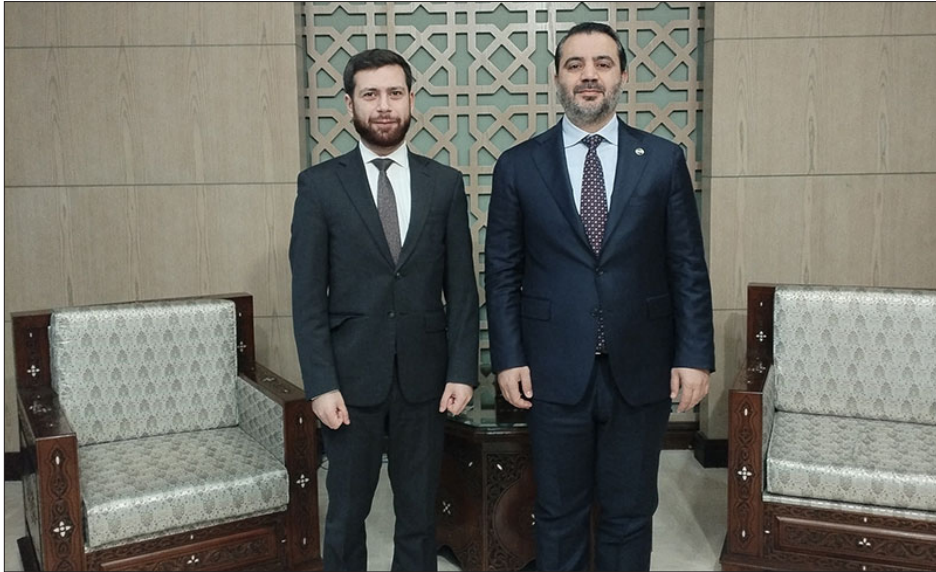
Սուրիոյ արտաքին գործերու նախարար Ասատ Ալ- Շայպանի եւ Հայաստանի արտաքին գործերու նախարարի տեղակալ Վահան Կոստանեան Դամասկոսի մէջ կայացած հանդիպումի ընթացքին

Հայաստանի արտաքին գործերու նախարարի տեղակալ Վահան Կոստանեան Յունուար 27-ին Դամասկոսի մէջ հանդիպում ունեցած է Սուրիոյ Արաբական Հանրապետութեան արտաքին գործերու նախարար Ասատ Ալ- Շայպանիի հետ: Այս մասին հաղորդագրութիւն տարածած է ՀՀ Արտաքին գործերու նախարարութիւնը: